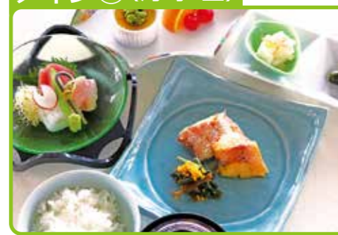
(B) 銀だろ照り焼き 赤魚粕漬け

4月除外日: 1日(土)、5日(水)～8日(土)、15日(土)、22日(土)、28日(金)～30日(日) 5月除外日: 1日(月)～7日(日)、13日(土)、16日(火)、17日(水)、20日(土)、27日(土)